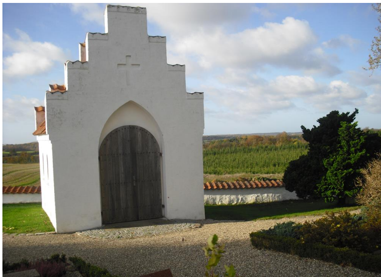
Bromme Kirke Kapel