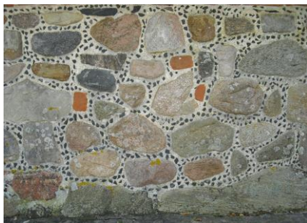
Munke Bjerby Kirke "mosaik"