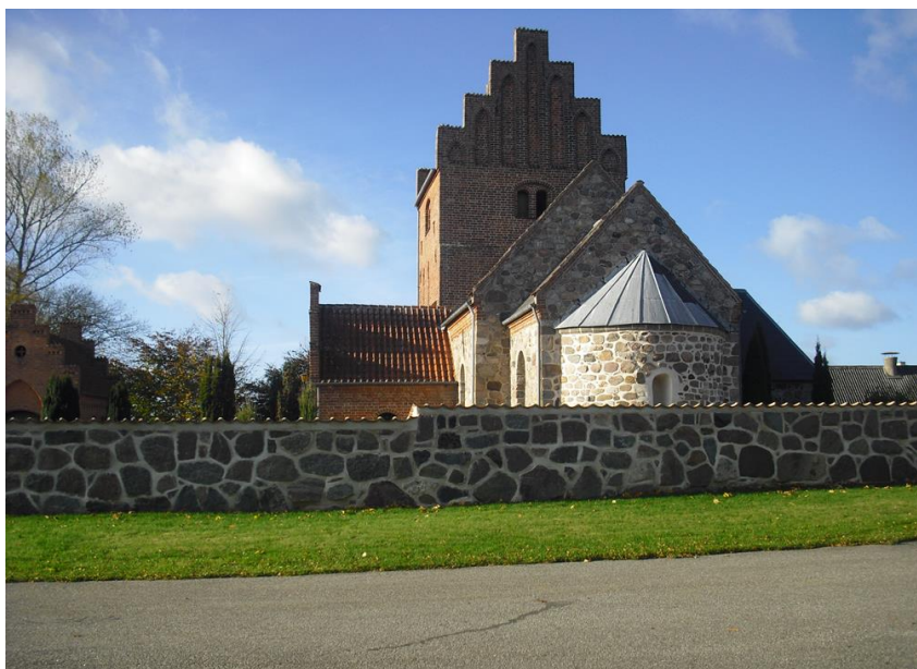
Kirke Flinterup Kirke