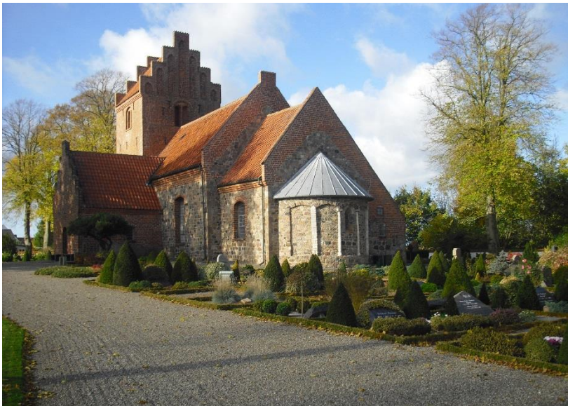
Munke Bjergby Kirke