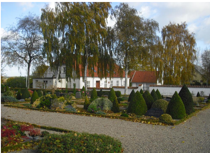
Munke Bjergby Kirkegård og Præstegård